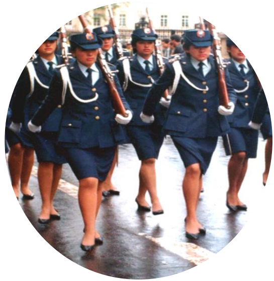
Imagen 2. Primer curso de mujeres suboficiales de la FAC - 1992.