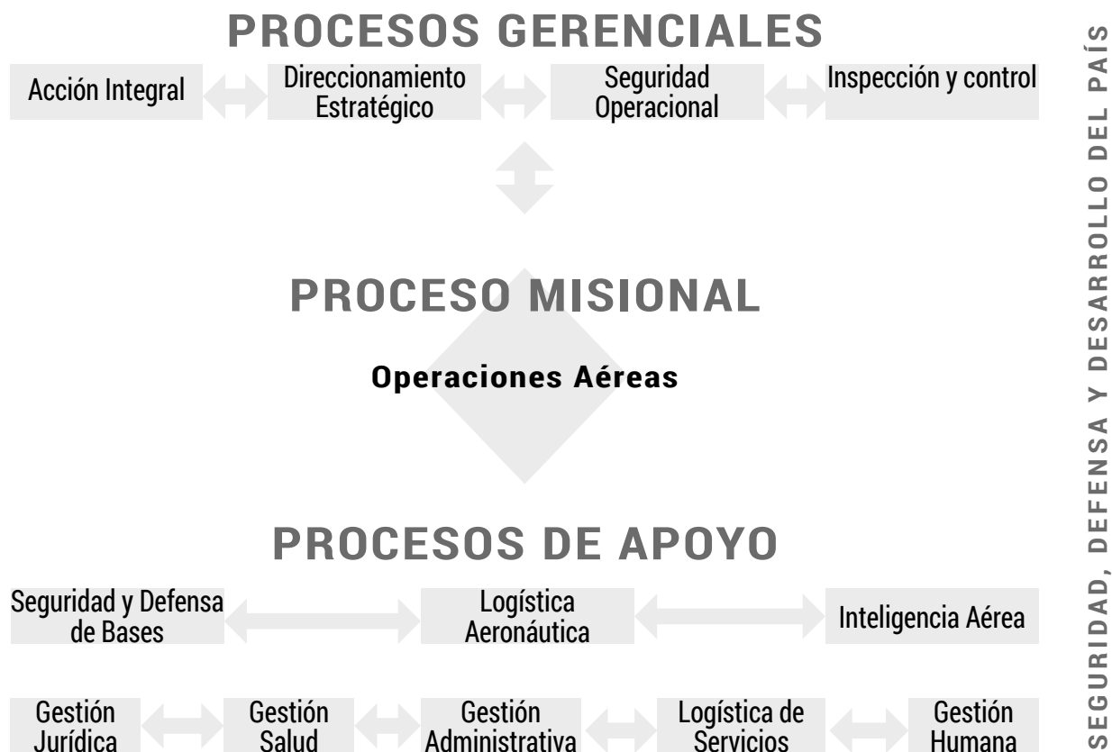
Gráfica 2. Mapa de procesos FAC -2011.

En síntesis, este trabajo busca contribuir al mandato de la CEV, el cual tiene como objetivo entre otros, el esclarecer y promover el reconocimiento de las transformaciones institucionales que se generaron en las instituciones militares en el marco del CANI. Por lo tanto, se configura una necesidad institucional que permita aportar satisfactoriamente al reconocimiento de las transformaciones de las FF.MM..