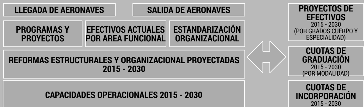
Gráfica 4. Dimensionamiento del tamaño de la Fuerza 2015 - 2030-