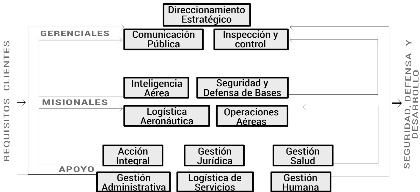
Gráfica 1. Mapa de procesos FAC -2005.

Este plan Institucional alineado con el sistema de gestión de la calidad que implementó la Fuerza en el año 2003 mediante la Ley 872 de 2003 y su Decreto Reglamentario 4110 de 2004, muestran que existen procesos gerenciales que se encargan de realizar el direccionamiento institucional, seguido de procesos misionales relacionados directamente con las actividades indelegables asociadas con el cumplimiento de la misión, y por último, los procesos de apoyo que contribuyen a la obtención de los resultados en los procesos misionales. Tal y como muestra el mapa de procesos de la FAC en el 2005 (MADBA, 2010, pág. 24).