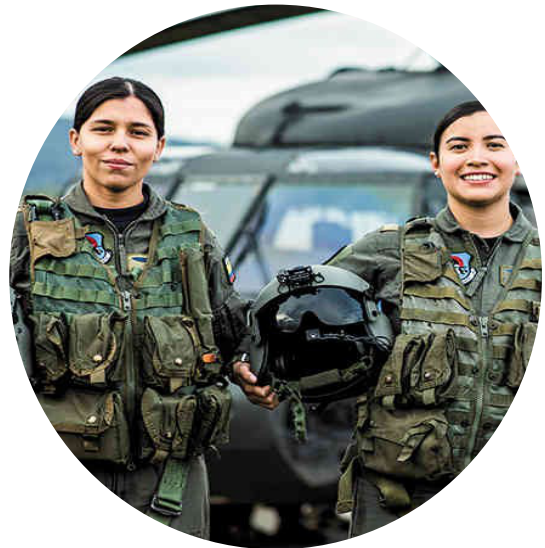
Imagen 3. Primera tripulación femenina de Black Hawk, 2018.