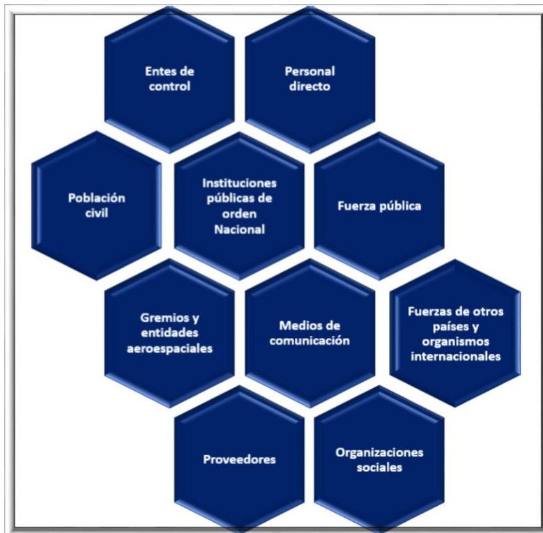
Figura 1: Identificación y caracterización de los grupos de valor FAC