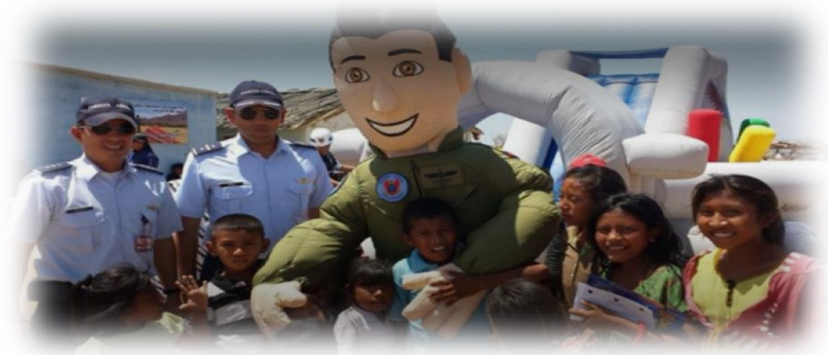
Imagen 1: Actividades con la población civil