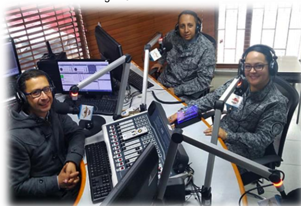
Imagen 3: Emisoras "Al Aire"