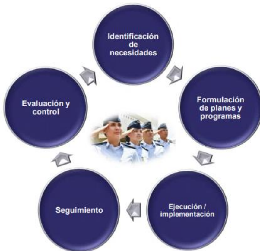
Figura 2: Fases del ciclo de la gestión pública