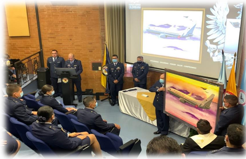
Imagen 4: Cátedra Aeronáutica