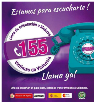
Campaña publicitaria de la línea de atención a mujeres, 155.